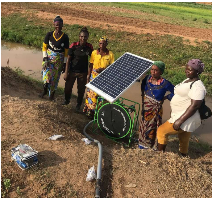
Zonne water pomp